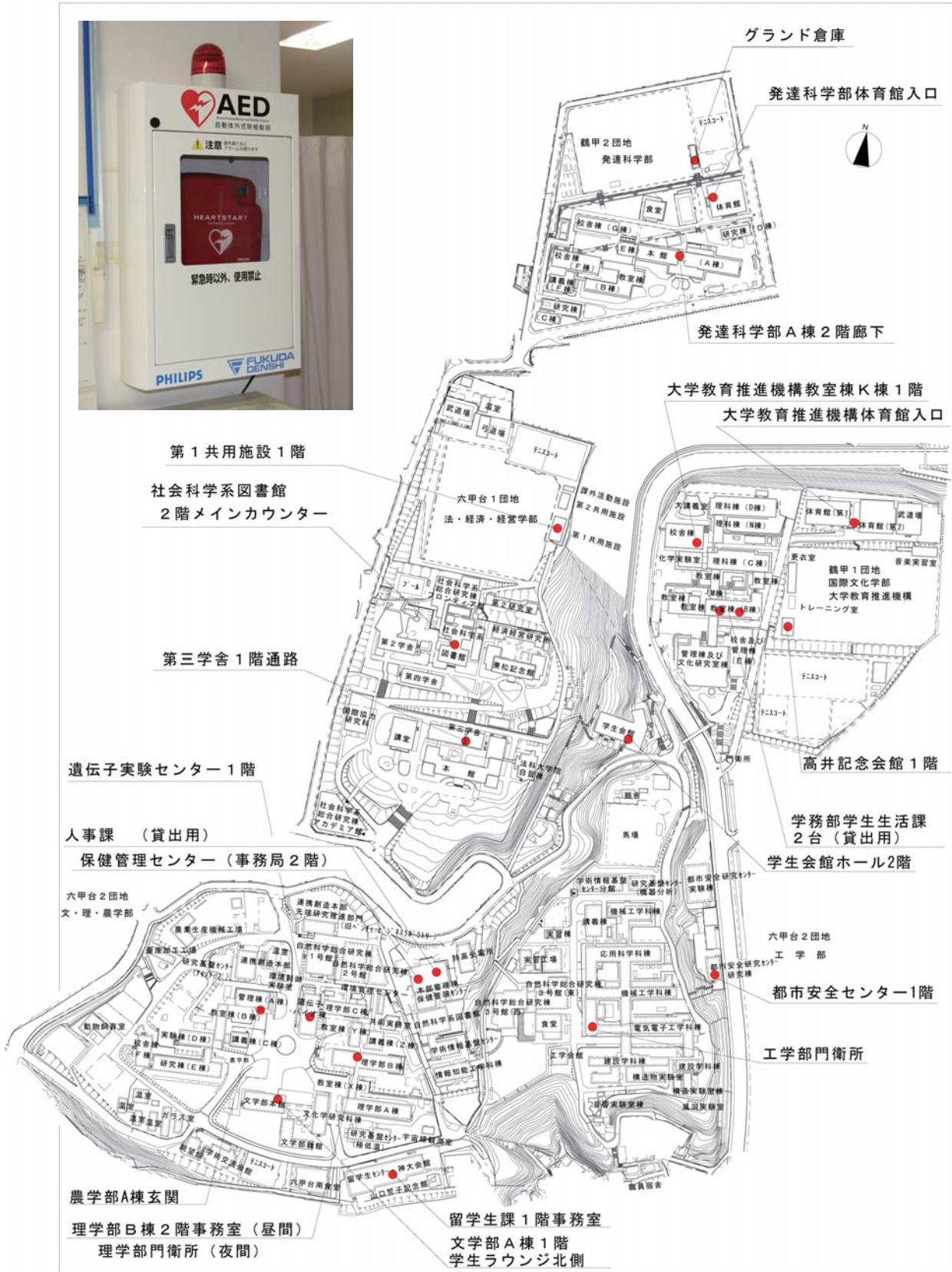
(図2) AED (左上) と、神戸大学六甲台地区におけるAED設置場所 [平成20(2008)年7月現在]

■ お問い合わせ 〒657-8501 神戸市灘区六甲台町 1-1 神戸大学保健管理センター ☎ 078-803-5245 〒658-0022 神戸市東灘区深江南町 5-1-1 神戸大学保健管理センター深江分室 ☎ 078-431-6232